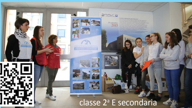
classe 2° E secondaria