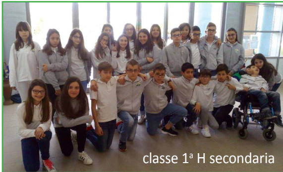
classe 1° H secondaria

Il 24 Agosto alle ore 3:36 un boato e una forte scossa ci hanno svegliato all'improvviso. Da quel momento la nostra vita è cambiata. Il nostro paese, le nostre case, molti dei nostri amici non ci sono più. Sono rimasti solo i ricordi. Non potendo più vivere in quei luoghi da fine Agosto, gran parte della nostra comunità si è trasferita, temporaneamente, negli alberghi a San Benedetto del Tronto. E' stato difficile lasciare la nostra terra. Al nostro arrivo ci hanno accolto tutti con grande affetto. Adesso viviamo in albergo, all'hotel Relax. Frequentiamo la classe 1° H della scuola secondaria di primo grado "M. Curzi". La nostra classe è composta da 26 alunni. Non eravamo abituati a stare in classi così numerose, tuttavia per noi questa è stata un'esperienza positiva. Fin dal primo giorno di scuola siamo stati circondati e accolti con tanto affetto sia dai nostri professori che dai nostri compagni. L'anno scolastico sta per terminare e noi, finita la scuola, torneremo a vivere ad Accumoli, nelle casette di legno dove staremo per molti anni fino a quando il nostro paese non sarà ricostruito. Siamo contenti che ritorneremo a vivere ad Accumoli, anche se ci dispiace molto lasciare le persone che ci sono state accanto in tutti questi mesi: i professori, i compagni di scuola, gli albergatori. Siete stati per noi la nostra seconda famiglia. Grazie, vi ricorderemo sempre con tanto affetto.